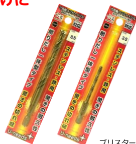
プリスターパック